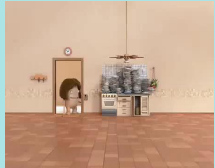
Mamá Luchetti – Luz https://youtu.be/w1toF_oXbas