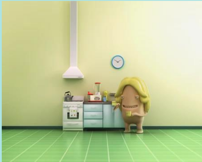
Mamá Luchetti – Licuadora https://youtu.be/58V1tJhHtBY