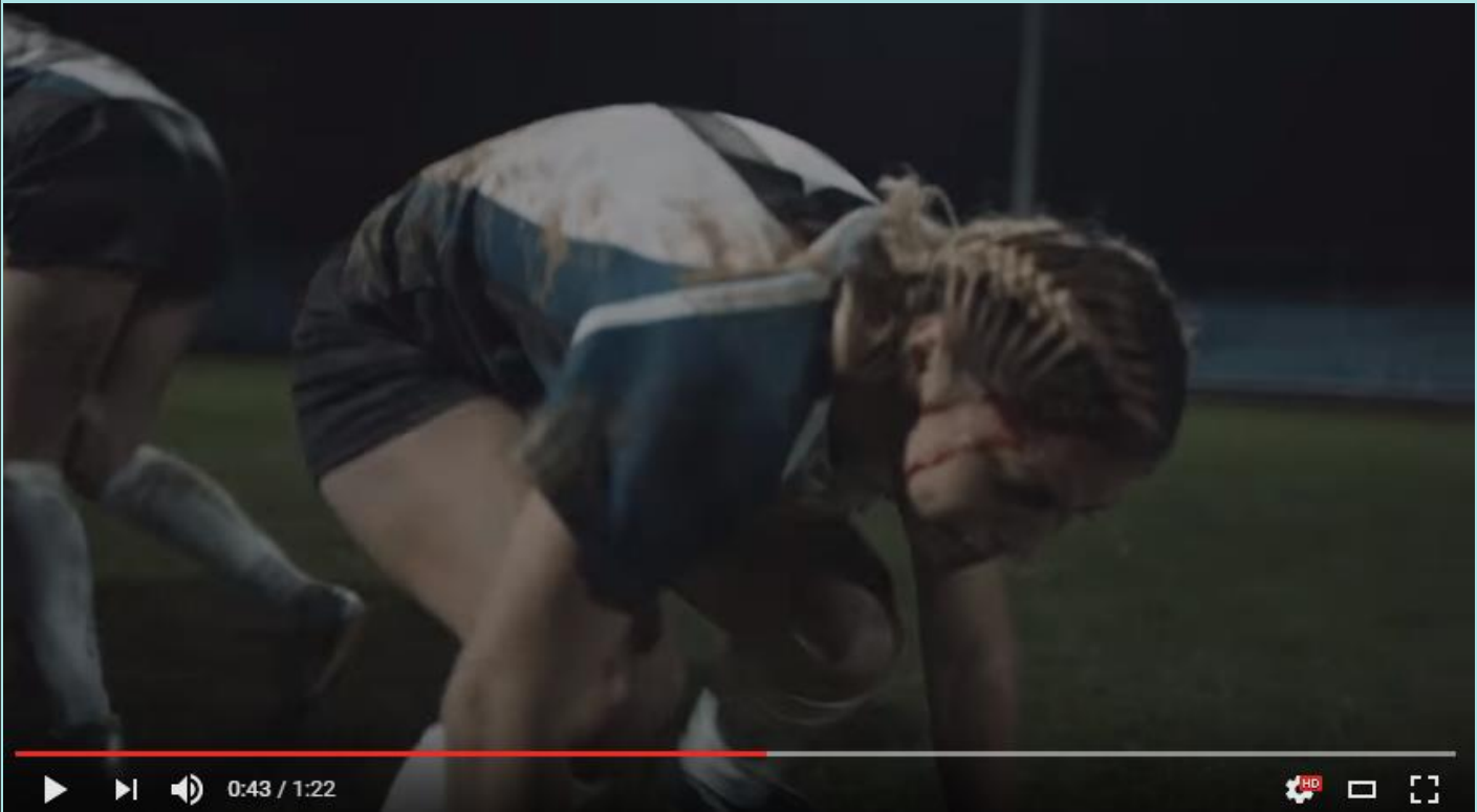
Bodyform - https://youtu.be/8Q1GVOYlcKc