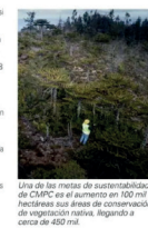
Una de las metas de sustentabilidad de CMPC es el aumento en 100 mil hectáreas sus áreas de conservación de vegetación nativa. Llegará a cerca de 450 mil.

reducción de gases de efecto invernadero, si bien en 2018 la compañía emitió 2.306 tCO 2 e, durante el 2021 las emisiones absolutas bajaron a 1.523 tCO 2 e, lo que representa una reducción de 34% y un avance de 31% respecto de la meta. Además de uso de agua industrial, en 2018 se redujeron 31,5 mil y en 2021 se alcanzaron 39,36 mil m 3 , es decir, una reducción de 1,74 mil m 3 y se superó el 24% respecto de la meta. Sobre los residuos, en 2018, 714 toneladas se enviaron a disposición final, pero para el 2021 eso disminuyó a 427,108 toneladas. En consecuencia, se redujo de 40% respecto de la meta en 2018. Por el otro lado, el primer avance de 2022, la compañía continuó reportando avances en sus proyectos. En el mes de mayo, se redujo de 7% en sus emisiones, 2% en el uso de agua por tonelada de producto y 27% en sus residuos, en comparación con el primer trimestre del 2021. Finalmente, acerca de las áreas de conservación y protección, si en 2018 la