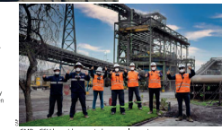
CMF y CSH han sido premiadas como las mejores pagadoras y pymes del país.