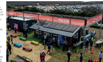
Parte de las soluciones del Grupo Cintac están hechas a partir del acero, material que tiene una serie de ventajas al ser 100% reciclable a lo largo de todo su ciclo de vida.

La industrialización de la construcción y el acero ha crecido en el mundo como alternativa para disminuir el déficit de hogares, dado que permite reducir los costos, plazos y la generación de residuos en el desarrollo y ejecución de proyectos.