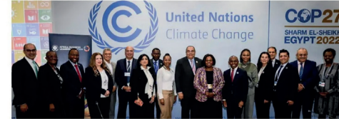
Miembros de la Oficina Mundial de Pacto Global de las Naciones Unidas, junto a líderes empresariales en la COP27, Egipto 2022.

Jefes de Estado, ministros y negociadores, junto con activistas climáticos, alcaldes, representantes de la sociedad civil y el sector privado, se reúnen desde el 6 al 18 de noviembre en la ciudad costera egipcia de Sharm el-Sheikh para el encuentro anual más importante sobre cambio climático.